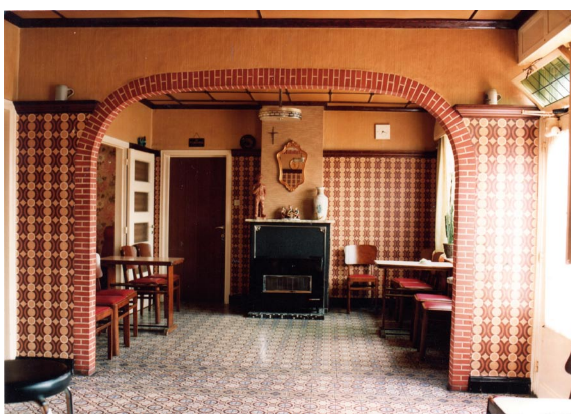
Het interieur