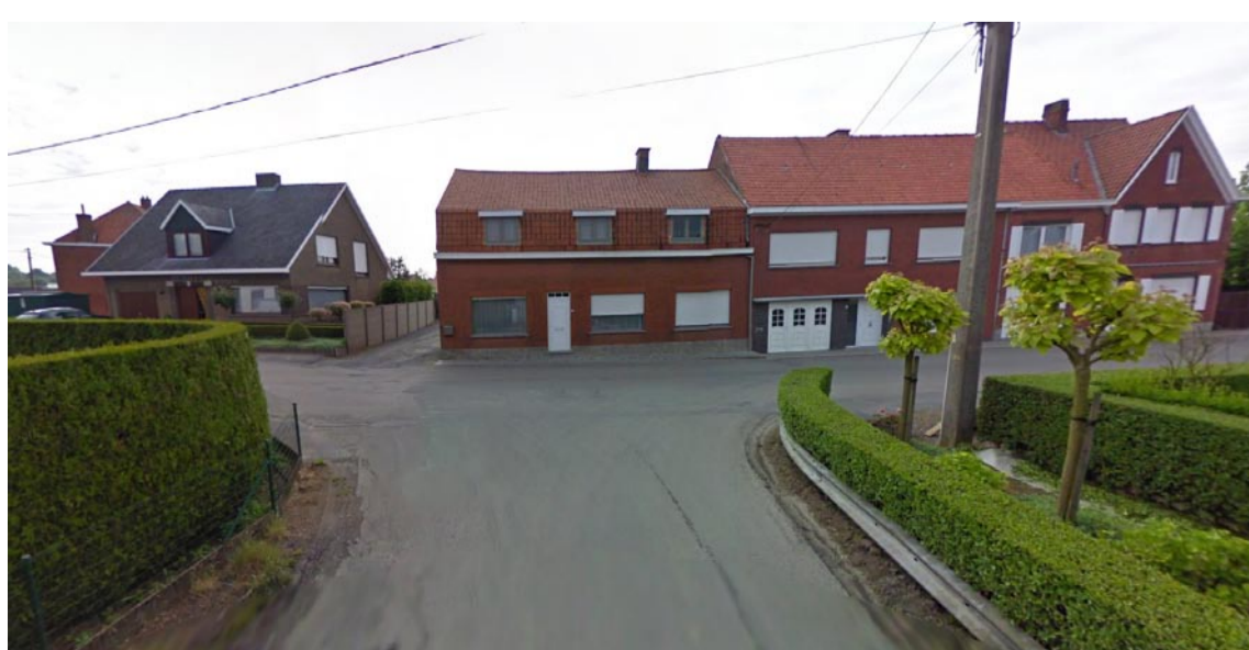
Toestand in 2014